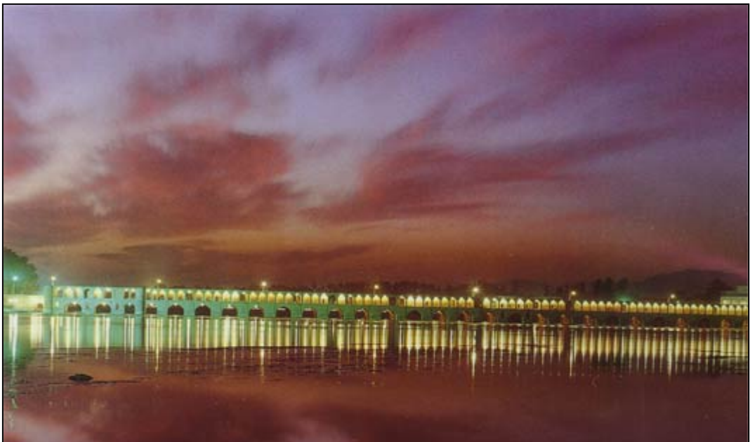
Sio seh pol ( Trettiotre broar )