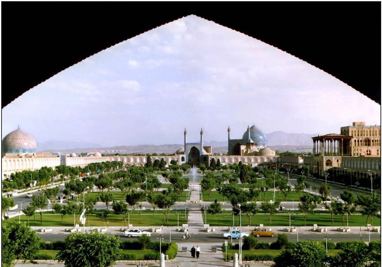
Naghsh-e Jahan Torget