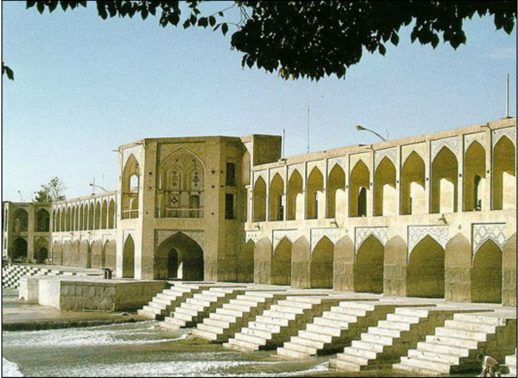
Pole Khajo ( Khajo bron )