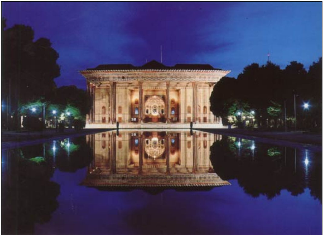
Chehelstoon ( Fyrtio-pelare-huset )