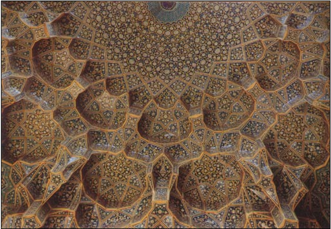
Madreseh Chaharbagh ( Taket på Fyragårdsskolan )